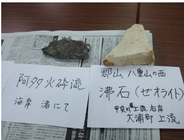
採取された土石の資料 1